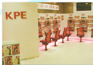
店舗床面用フィルム