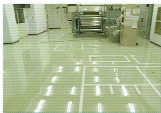
工場床面用フィルム(クリーンルーム)

「美しく心地よい環境を」 タカラコーポレーションが追求する願いをコンセプトに開発した新素材のマークです。