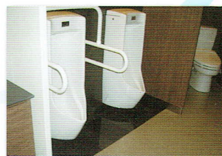
トイレ足元フィルム